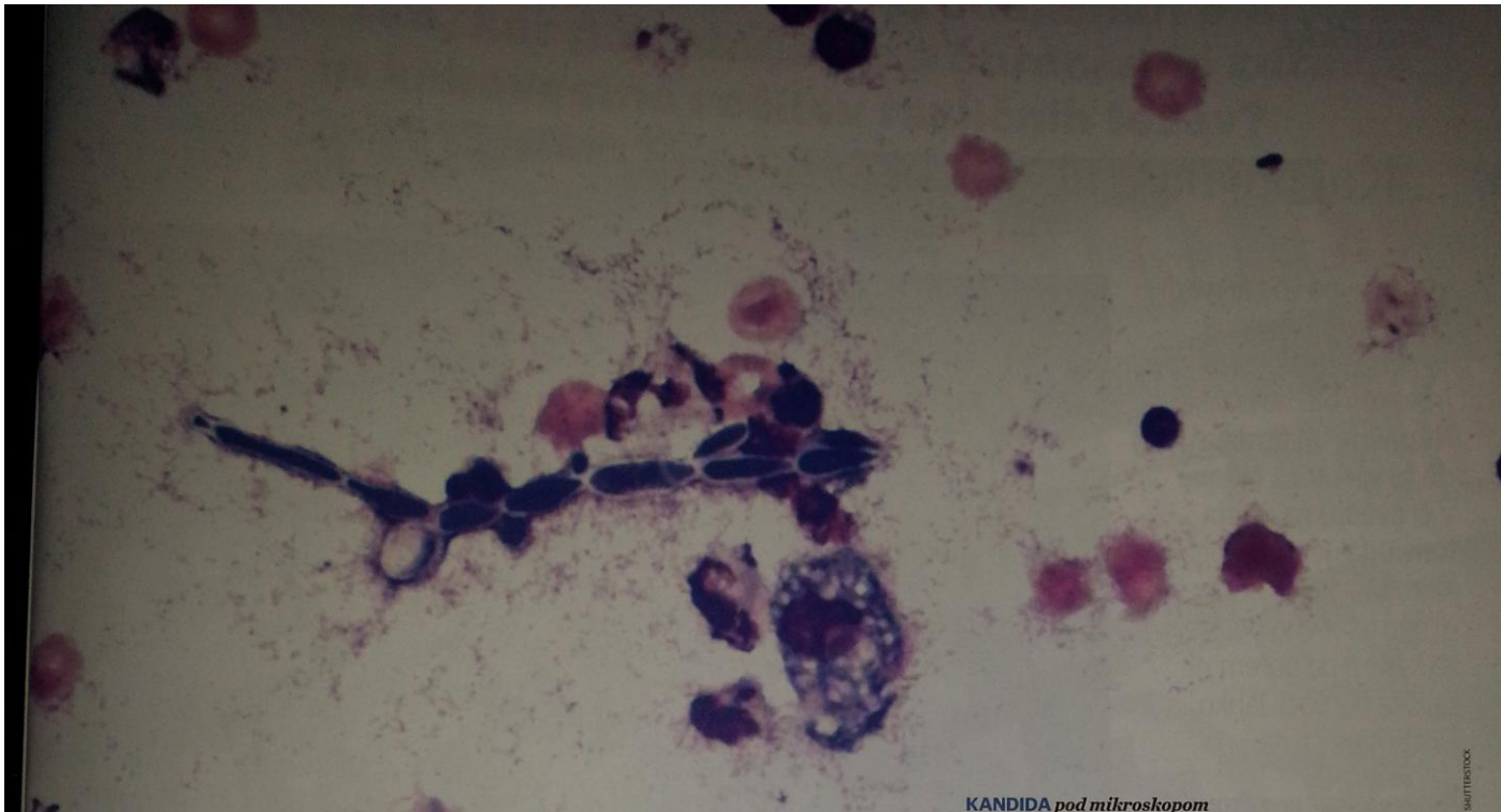
KANDIDA pod mikroskopom